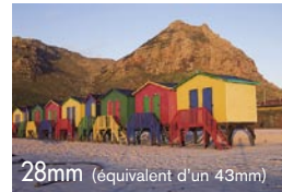
28mm (équivalent d'un 43mm)