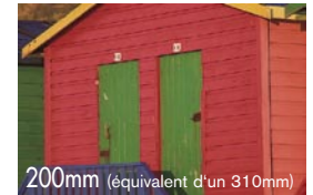
200mm (équivalent d'un 310mm)