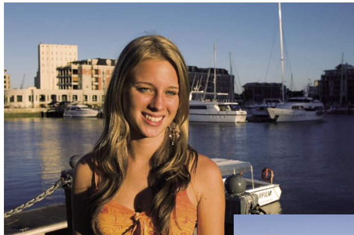
28mm (équivalent d'un 43mm) Exposition : programmée Auto ISO100

* Les valeurs indiquées correspondent aux appareils Nikon AF